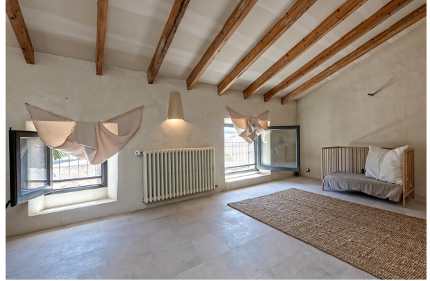
TV room (1st floor)