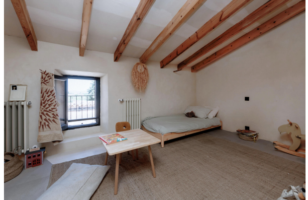
Bedroom 3 (1st floor)