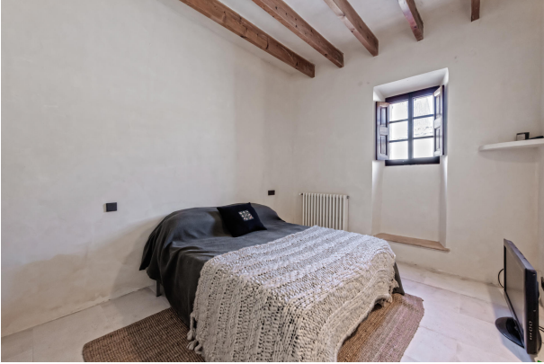
Bedroom 4 (ground floor)