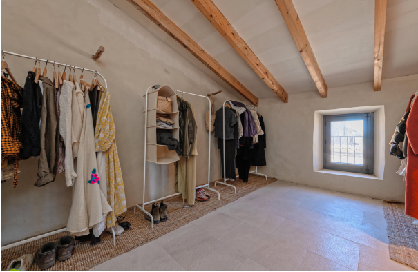
Bedroom 2 (1st floor)