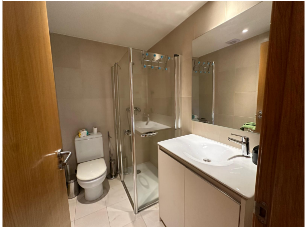
WhatsApp Image 2024-06-28 at 13.14.29 (5)