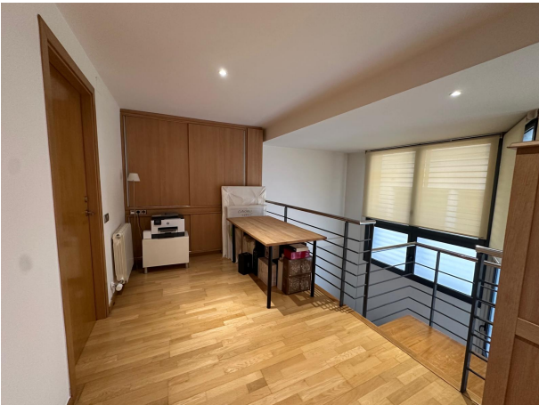
WhatsApp Image 2024-06-28 at 13.14.29 (6)