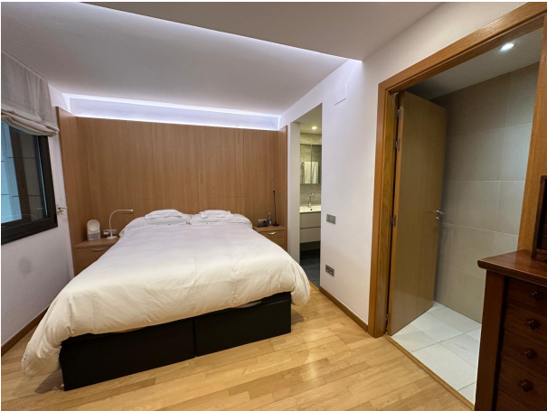
WhatsApp Image 2024-06-28 at 13.14.29 (4)